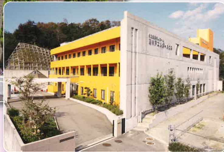
西神戸エルダーハウス 外観