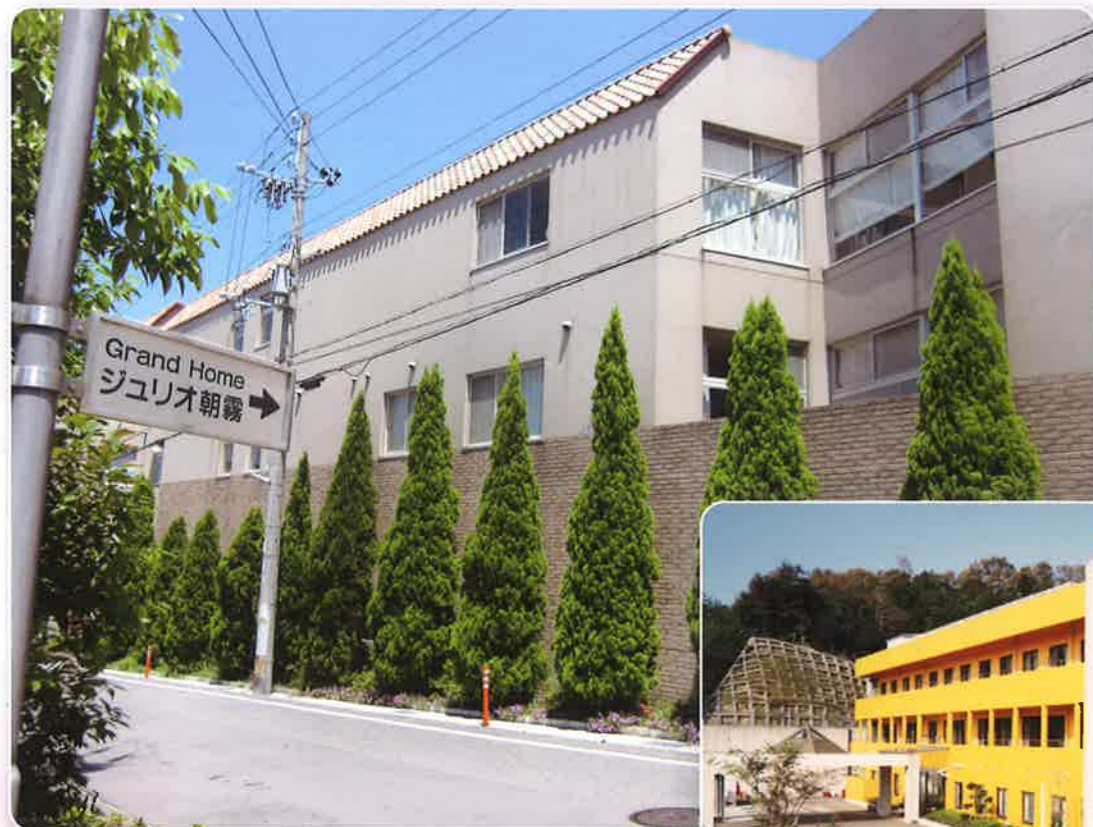
ジュリオ朝霧 外観